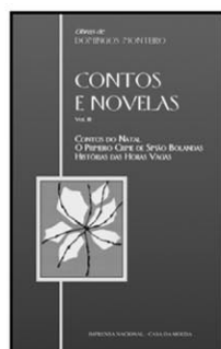
CONTOS DO NATAL O PRIMEIRO CRIME DE SIMÃO BOLANDAS HISTÓRIAS DAS HORAS VAGAS