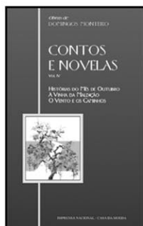
HISTÓRIAS DO MÊS DE OUTUBRO A VINHA DA MALDIÇÃO O VENTO E OS CAMINHOS