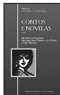
HISTÓRIAS CASTELHANAS HISTÓRIAS DESTA MUNDO E DO OUTRO O DIA MARCADO