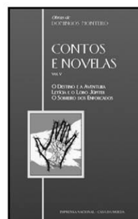
O DESTINO E A AVENTURA LETÍCIA E O LOBO JÚPITER O SOBREIRO DOS ENFORCADOS