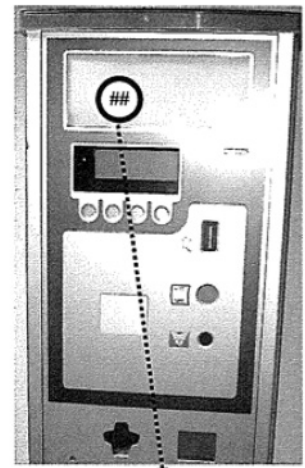
Localização do SELO de VERIFICAÇÃO PERIÓDICA