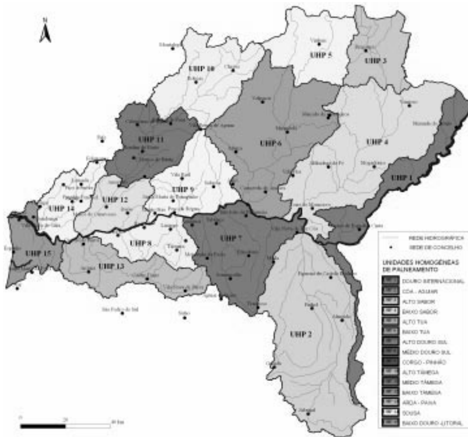
Figura 1 — Unidades Homogêneas de Planeamento